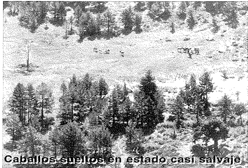
Caballos sueltos en estado casi salvaje