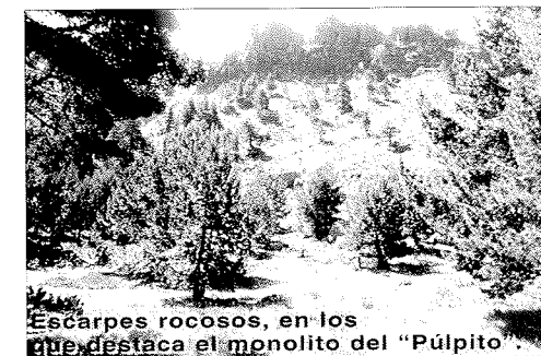
Escarpes rocosos, en los que destaca el monolito del "Pulpito".

Llegó el desastre en forma y por medio, del entonces llamado Patrimonio Forestal, ICONA o algo parecido. La eterna canción: las ganas o afán