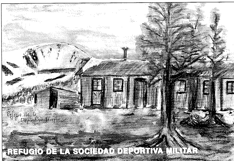
REFUGIO DE LA SOCIEDAD DEPORTIVA MILITAR

Fué al bajar de la cumbre cuando al llegar a la Pradera del Esteralbo, vimos