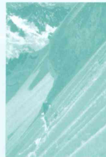
Udaondo en la Aiguille Verte en Agosto de 1973. Couloir Cord

En este audiovisual nos mostrará su evolución como montañero, desde sus inicios en montañas del País Vasco y Picos de Europa, con cuerdas de cáñamo, albarcas y botas de cuero duras fabricadas por un artesano con una cinta de correa transportadora, pasando por los Pirineos y los Alpes, ya con materiales un poco más modernos, hasta llegar a los momentos actuales en los que sigue en activo practicando el alpinismo, incluso en otros continentes.