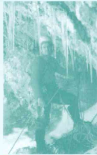
En el canal Del Pájaro Negro